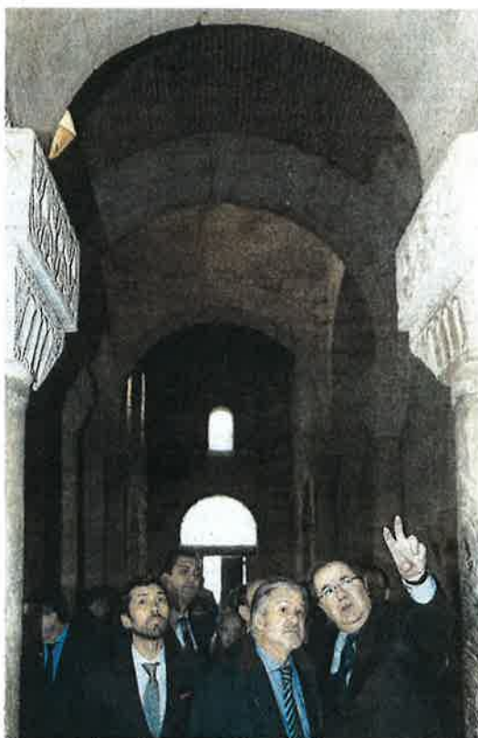
Herrera muestra los capiteles a otras autoridades.

Herrera hizo estas declaraciones en la inauguración de la restauración de la iglesia de San Pedro de la Nave, en El Campillo (Zamora), dentro del programa del Románico Atlántico, cuya cobertura en pro del patrimonio medieval se ampliará hasta 2018, según anunciaron el jefe del Ejecutivo e Ignacio Sánchez Galán, presidente de Iberdrola, entidad colaboradora. «La innovación ha estado muy presente en la actuación realizada en San Pedro de la Nave», afirmó Herrera, en alusión a las modernas técnicas de conservación utilizadas, tanto en la