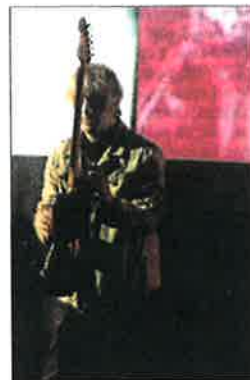
Lee Ranaldo en un concierto.