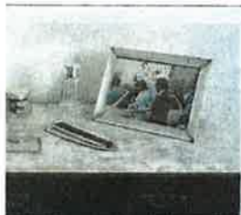
1. 'Animal liberation', de Sergio Garrido, en Sildavia. 2. 'Merkel', de José Consuegra, en Beluga Bar. 3. 'Mis padres', de Alejandro Antoraz, en El Carrusel. 4. 'Big Bag', de Ricardo M. Coloma, cines Manhattan.

Herrera aludió también a la consideración como «activo económico y recurso de enorme potencial» de la nueva actuación dentro del Románico Atlántico y al papel desempeñado por la Administración autonómica en la puesta en marcha de la Plataforma EVOCH como grupo de trabajo y colaboración permanente en Europa en torno al valor económico del patrimonio cultural. Por cada empleo directo en patrimonio se generan otros 26 empleos indirectos. Cada millón de euros invertido induce la creación de más de 200 nuevos puestos de trabajo, por elegir dos índices.